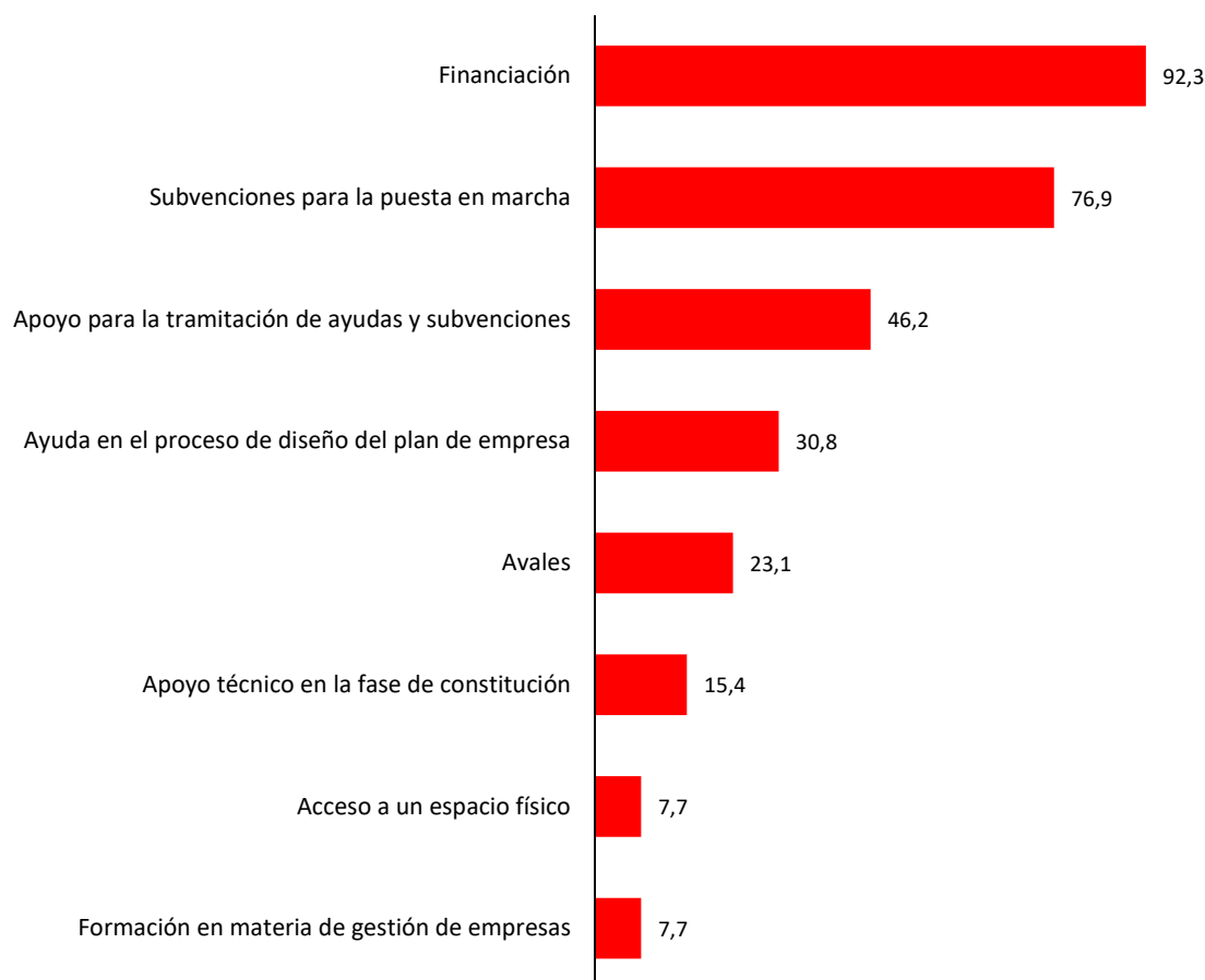
Gráfico 2. Recursos más demandados por los emprendedores. Municipio de Murcia, 2023 (% de respuestas obtenidas)