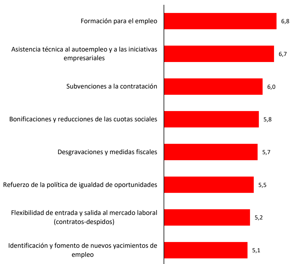
Gráfico 1. Nivel de desarrollo de las medidas para la creación de empleo. Municipio de Murcia, 2023 (Promedio escala 0 a 10)